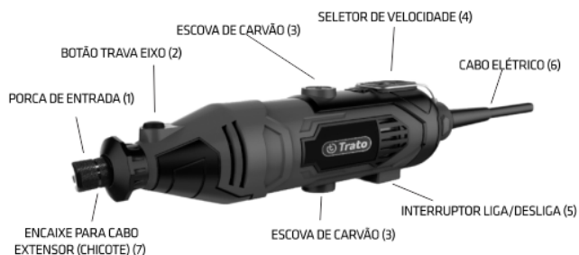
Figura 1: Principais partes da micro retífica.