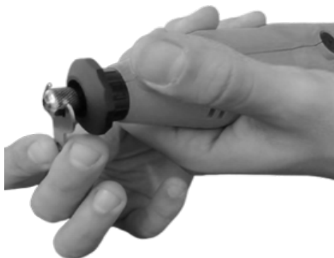
Figura 3: Retirada da porca de entrada (1).

* A porca de entrada (1) tem o encaixe de 1/8".