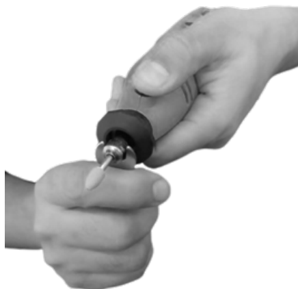
Figura 4: Fixação do acessório desejado.

2°) Coloque o acessório desejado, como exemplo abaixo, a pinça de fixação já vem inclusa no aparelho. Rosqueie a porca de entrada (1) e pressione o botão trava eixo (2) novamente com ajuda da chave de boca.