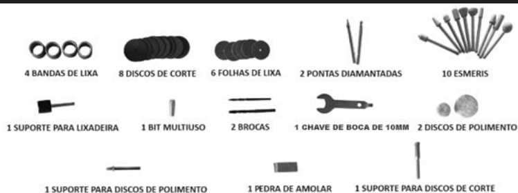
Figura 2: Acessórios da micro retífica.