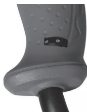
Figura 6: Seleção de velocidades.

4. Selecione a velocidade desejada pelo seletor velocidade (5):