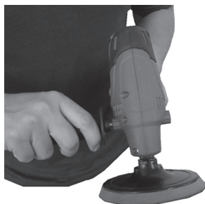
Figura 4: Encaixe do suporte lateral (2) em um dos lados.

2. Rosqueie o suporte lateral (2) tanto do lado direito quanto do esquerdo, conforme sua necessidade: