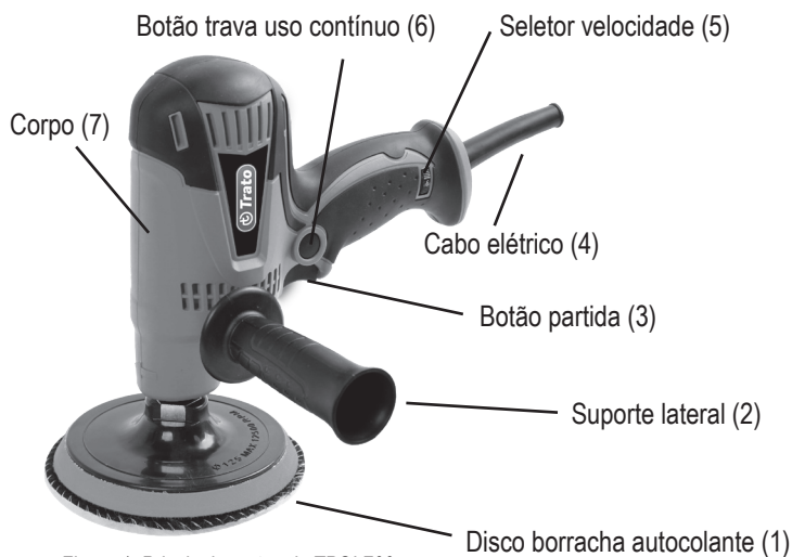
Figura 1: Principais partes da TPOL700