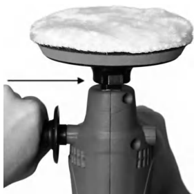
Figura 3: Encaixe do disco borracha (1).

1. Encaixe e rosqueie no sentido horário o disco borracha autocolante (1) e aperte com a chave trava eixo (9) conforme indicado na figura abaixo: