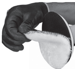
Figura 5: fixação da boina de lã autocolante (8).

3. Instale a boina de lã autocolante (8) fixando sobre o disco borracha (1). Certifique-se de centralizar bem para evitar vibrações: