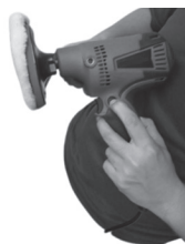
Figura 7: Acionamento do botão trava uso contínuo (6).

5. Ligue sua poltriz e lixadeira conectando o aparelho na voltagem adquirida e acionando o botão partida (3). Utilize o botão trava uso contínuo (6), caso necessário, para um maior conforto na utilização em longos períodos: