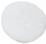
Boina de lã com autocolante (10)