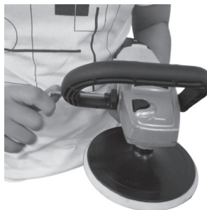
Figura 4: Fixação dos parafusos da alça multidirecional (8).

2. Com o auxílio da chave allen (12) fixe o suporte (8) no sentido horário em qualquer um dos lados, conforme a necessidade: