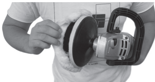
Figura 5: Encaixe da boina lã com autocolante (11).

3. Coloque a lixa autocolante (11) ou a boina de lã com autocolante (10) conforme sua necessidade: