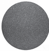
Lixa autocolante (11)