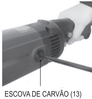
Figura 9: Troca adequada das escovas de carvão.

Quando for necessário o uso de cabo de extensão em áreas externas, certifique-se de que o mesmo esteja em boas condições, não apresente danos e suporte a corrente necessária para o consumo da politriz e lixadeira, visto que um cabo subdimensionado poderá provocar uma queda de tensão*. *O mínimo recomendado é uma bitola de 1,5 mm 2 para o uso do produto.