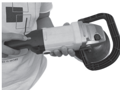
Figura 7: Seleção da velocidade desejada

5. Selecione a velocidade desejada pelo seletor velocidade (6):