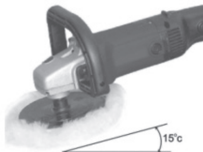
Figura 8: Ângulo e posição adequada para o uso da TPOL1300