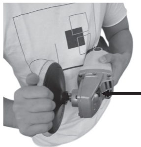
Figura 3: Encaixe da disco borracha autocolante (1).

1. Pressione o botão trava engrenagem (9) e gire o disco borracha autocolante (1) no sentido anti-horário até travar: