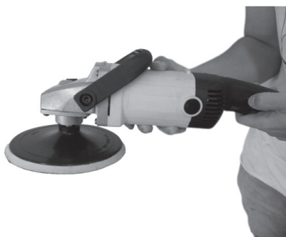
Figura 6: Botão trava partida (5) sendo acionado.

4. Conecte o aparelho na tomada atentando-se à voltagem do local e do aparelho. Ligue seu aparelho pelo botão partida (3) e utilize o botão trava partida uso contínuo (5), caso necessário, para um maior conforto na utilização em longos períodos: